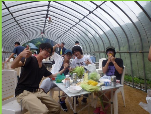
次第に盛り上がり始めています。