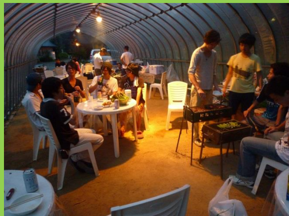
たっぷりとお肉を頂き、皆ご満悦！本当においしかった。外はすでに暗くなってきました。