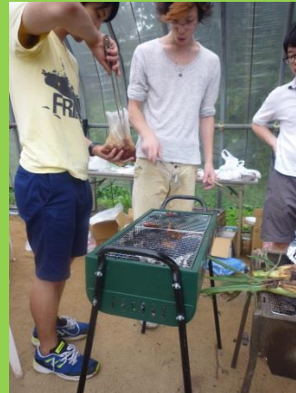
炭が出来上がり、早速BBQの開始。まずは安めの肉から。。。炊飯器のごはんも炊けています。