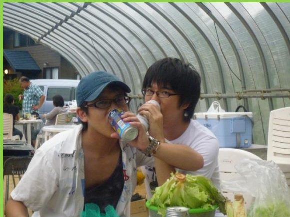
仲良くビールを飲み交わしています！