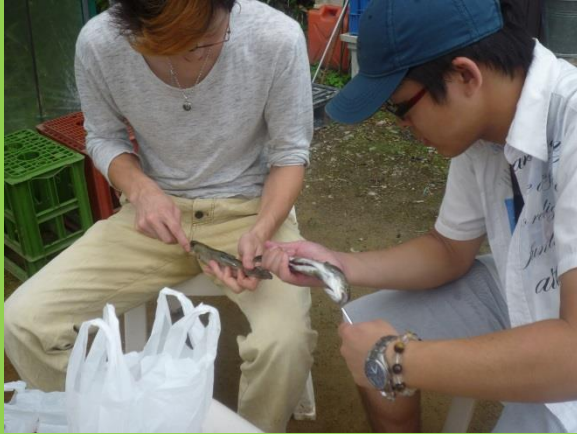
ニジマスを調理中。といっても串を刺しているだけなのですが。