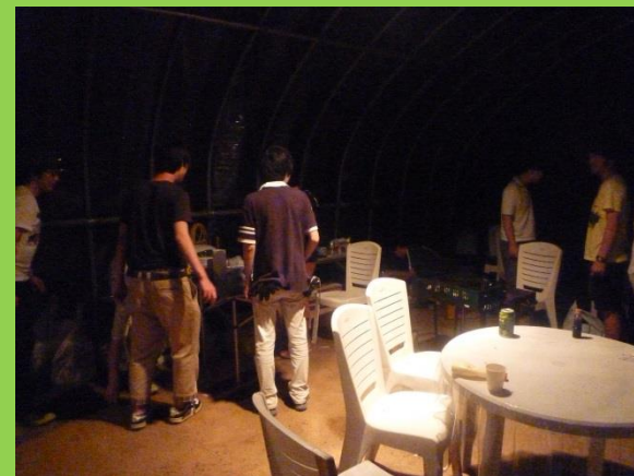
地面に落ちているゴミまで拾い、きれいに掃除しました。