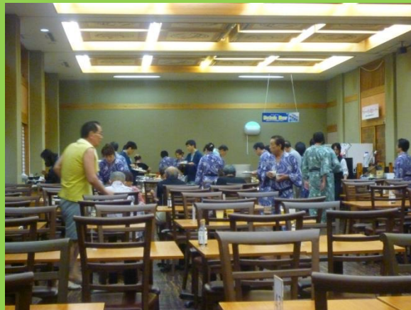
チェックイン後、温泉で体の疲れを取り除きます。17:30から夕食。1時間30分の食べ放題、飲み放題。バイキ