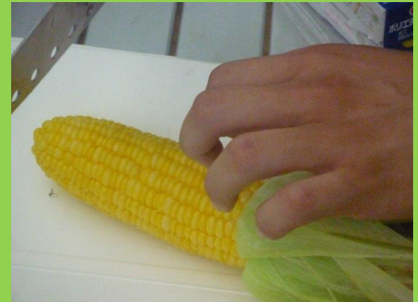
トウモロコシ蒸しあがりしました。地元のもので。本当にあまい！