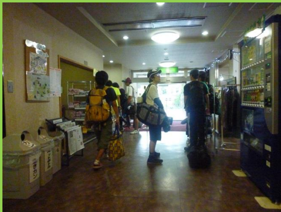
車で1時間でつぎの宿に到着。伊藤園ホテル老神山楽荘。なかなかGoodなホテル。