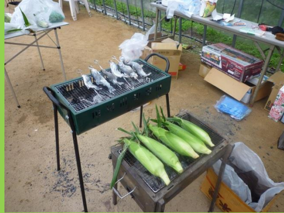
炭に火がついたため、トウモロコシ、魚を焼き始めています。