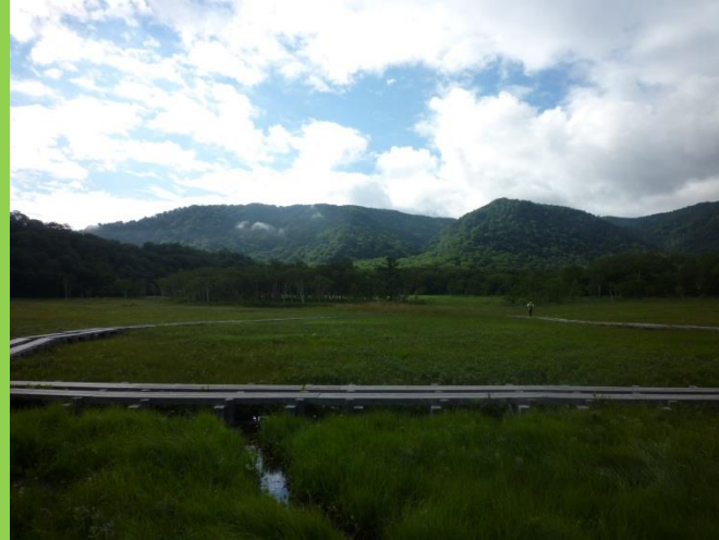
次第に日が高くなっていきます。それに伴って気温も上昇。天気が良くて本当によかった。