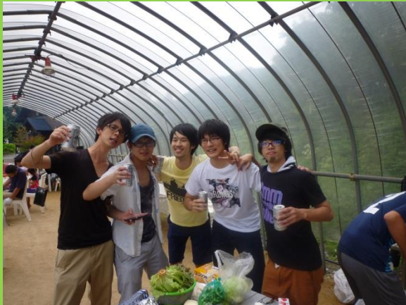
待ちきれずにビールで乾杯！