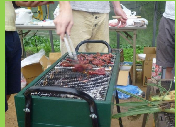
肉がおいしそうに焼けています。