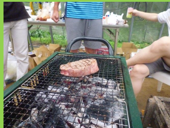
本日のメインである黒毛和牛ヒレが焼きはじまりました。