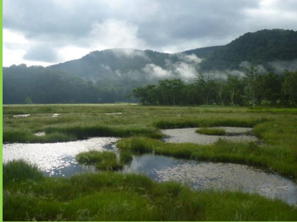
遠くで霧が立ち込め、日光が降り注いでいます。