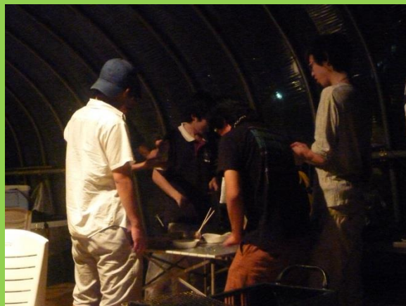
夜の20:30になり、皆でお片付け。