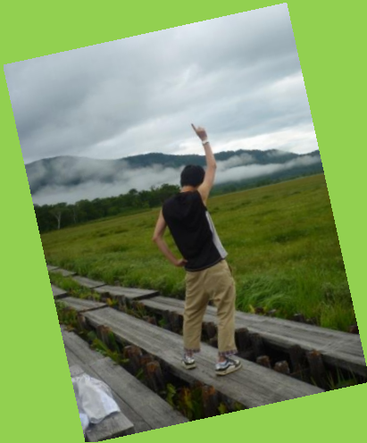
ゼミ長。ポーズありがとうございます。