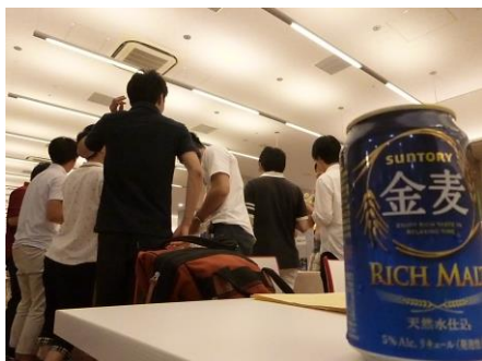
2時間にわたるお疲れさん会。みなさん本当にご苦労様でした。