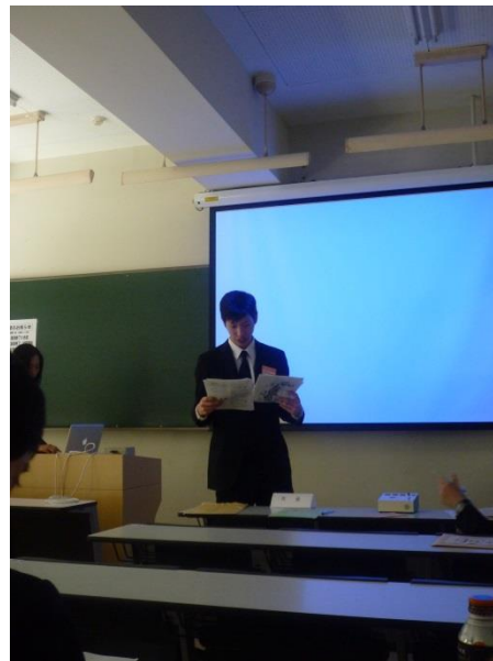
座長がタイトルと発表者名を読み上げています。