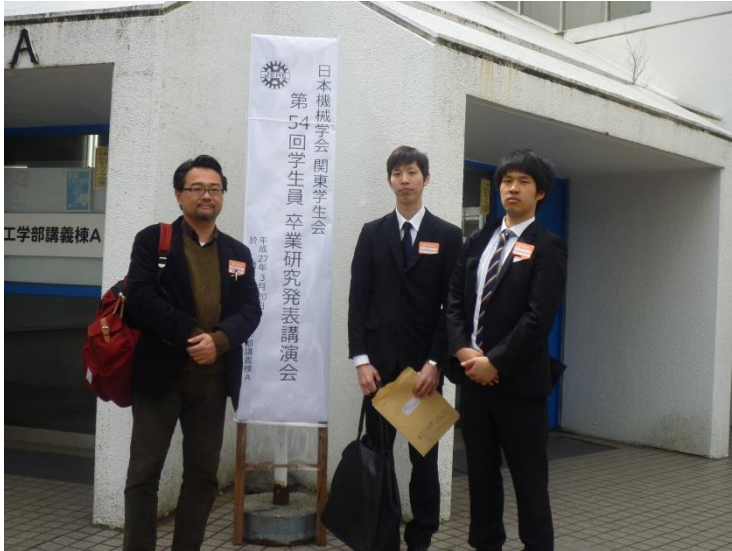
発表前に記念撮影.