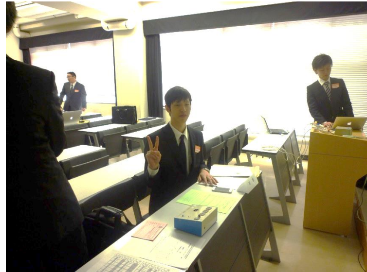
B4原君が座長を務めました.