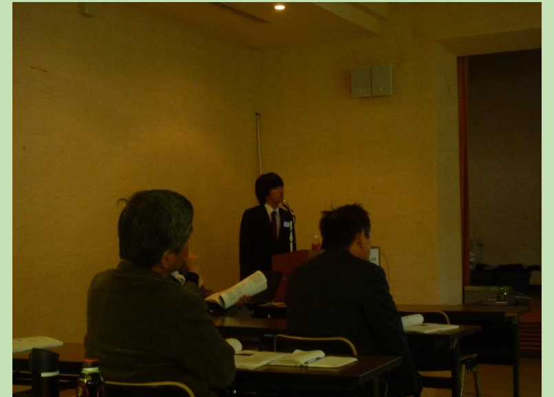
会場よりたくさんの質問を頂きました！