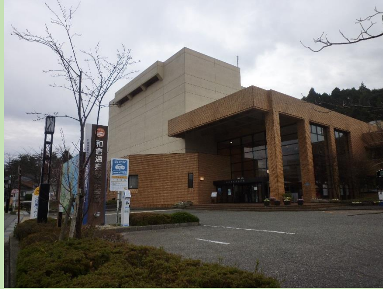
学会が開催された和倉温泉会館の外観。