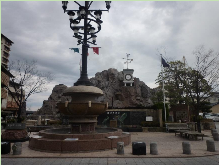
閑散とした街の真ん中。