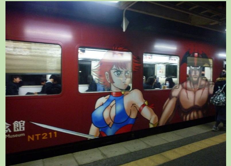
七尾駅で乗り換え。のと鉄道七尾線。 17:52。2両編成に乗り換えます。