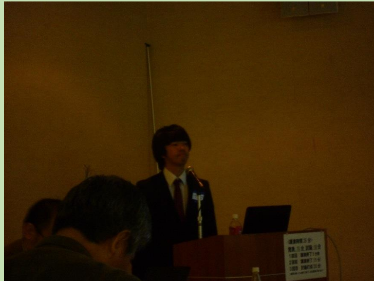
早朝10:00ごろより貫井(M1)が発表。