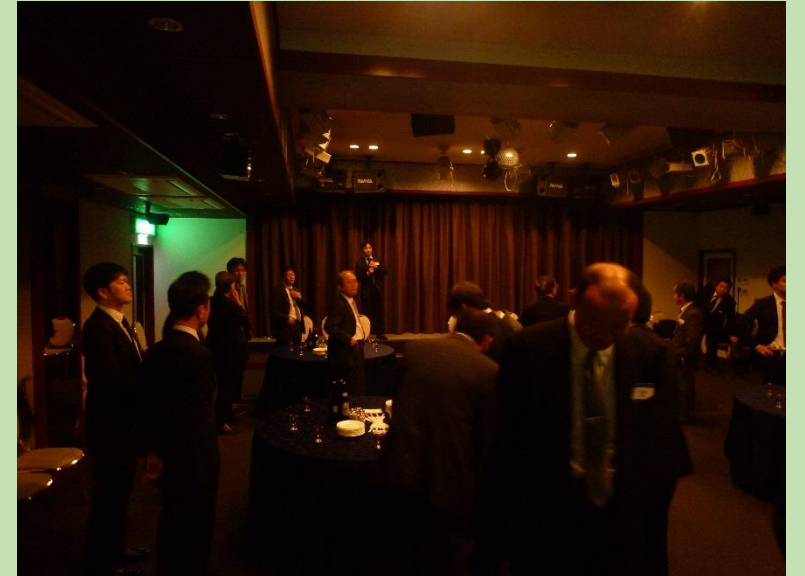
夕方17:30まで学会。18:00から懇親会。