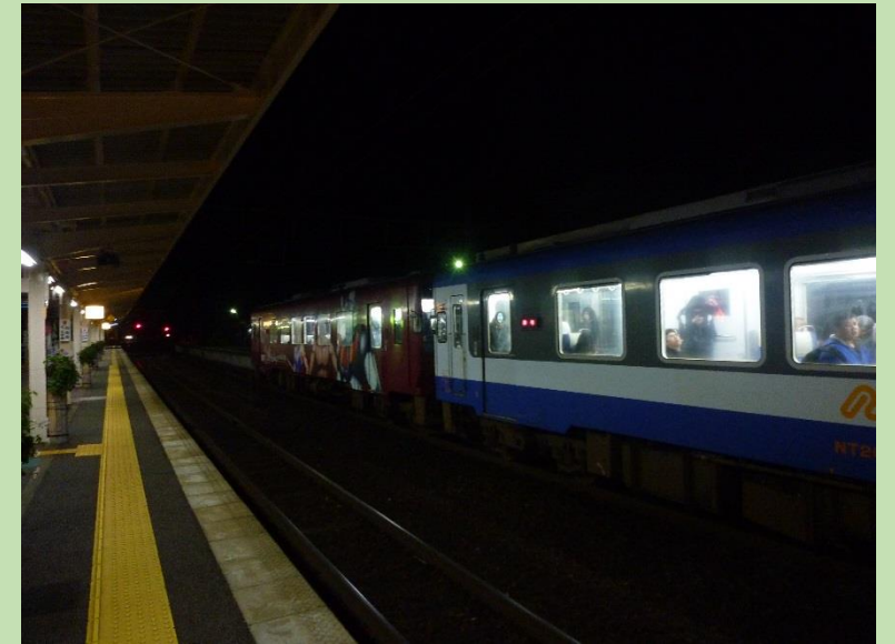
和倉温泉に17:58に到着。