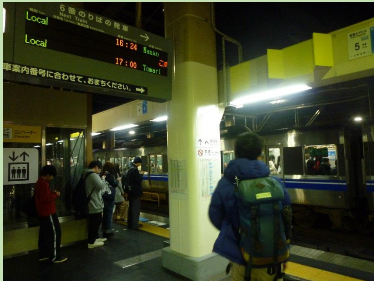
七尾線では各駅停車の4両編成。