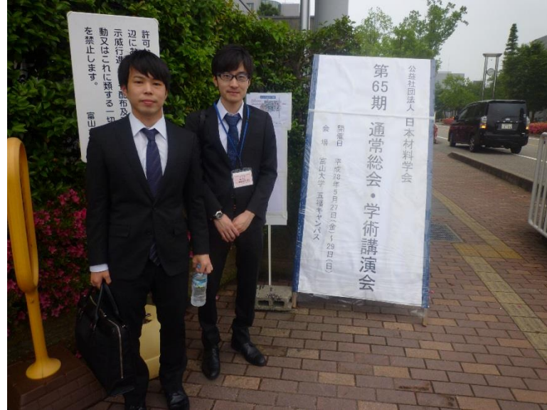
8:40ごろに富山大学へ到着.