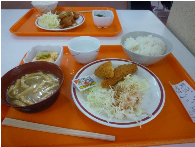
富山大学到着後，食堂にて定食.