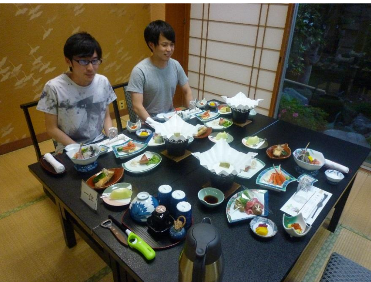
本日の夕食. すごい量の夕食.