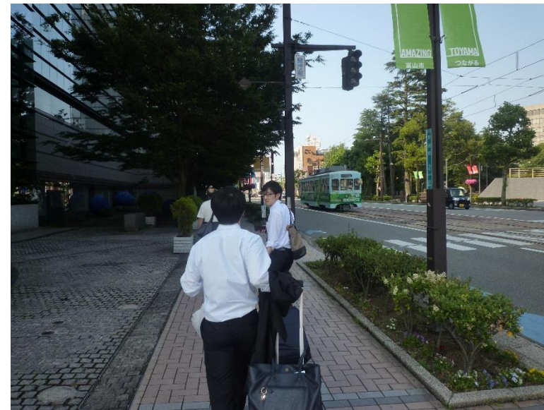
16:00ごろまで公開部門委員会に出席し，予約した旅館へ移動しました.