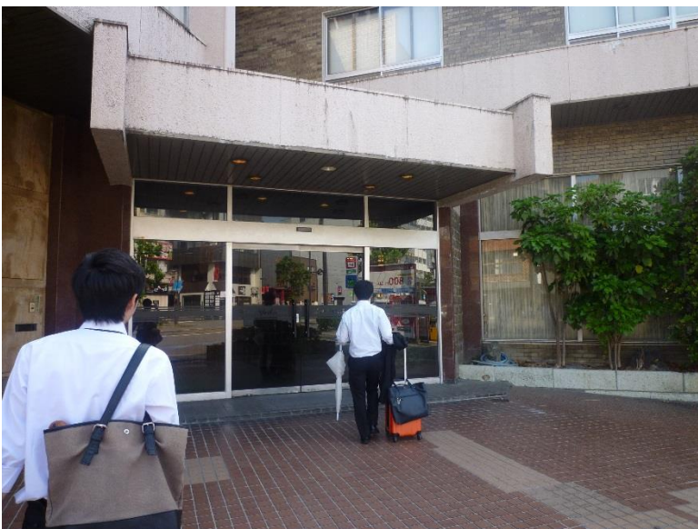
ホテルよし原に到着．外観は随分傷んでいました.