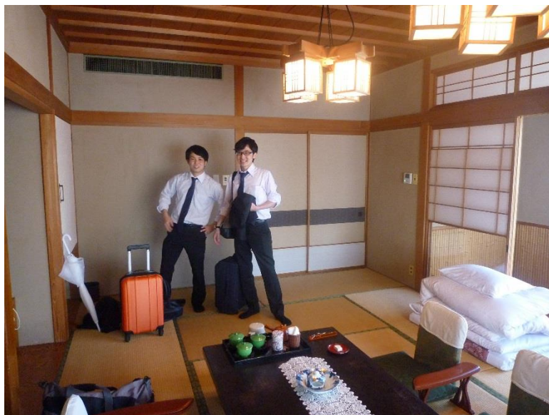
外観に比べて室内は清潔でした．今回は3名一室.