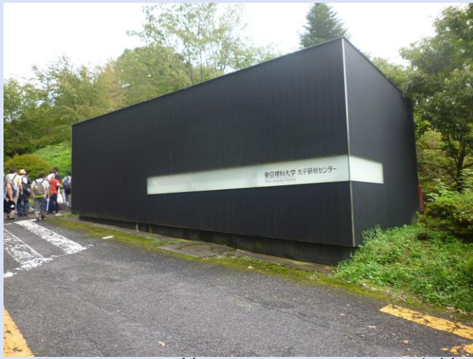
13:45に研修センターに到着しました。