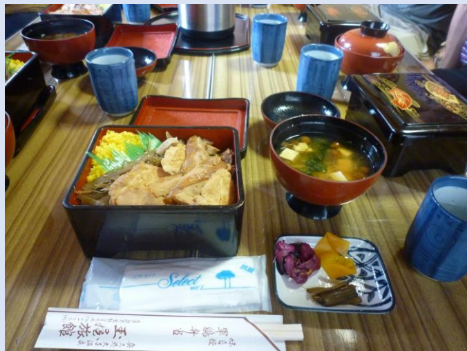
しゃも弁当。かなりのボリュームでした。味は抜群！