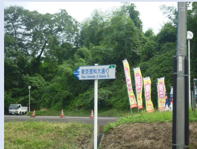
研修センター前の通りが“東京理科大学通り”と名付けられています。