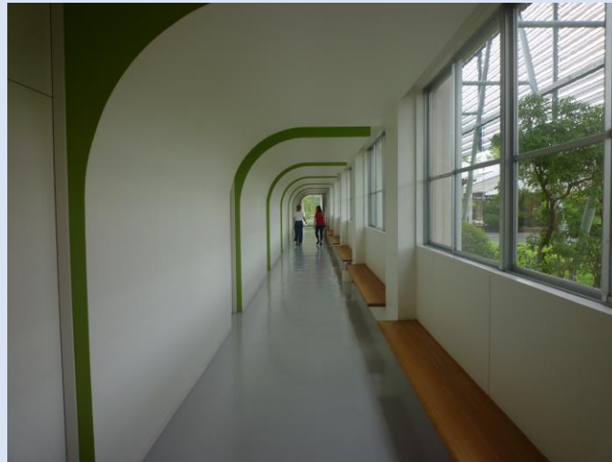
研修センター内部。もと女子高校の校舎がリニューアル。