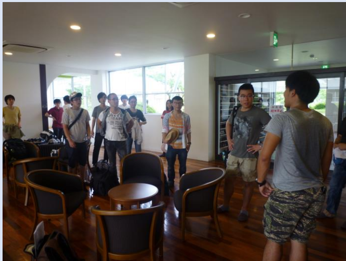
午後の予定について話しています。