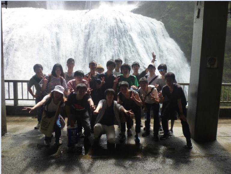
みんな、汗だくでした。