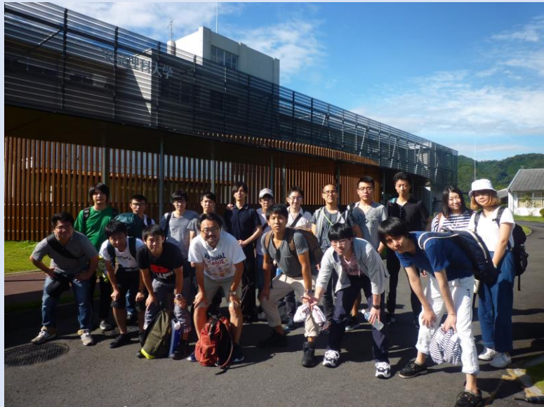
7:30 朝食 ⇒ 8:30に出発!