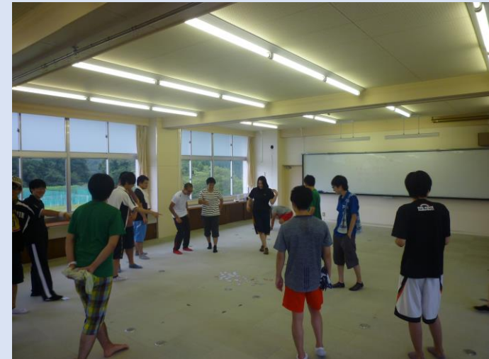
外は大雨。サッカーの予定を変更。かるた大会。