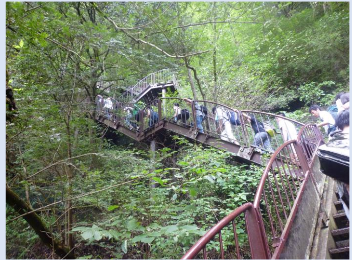
袋田の滝の後、さらに生瀬の滝へ