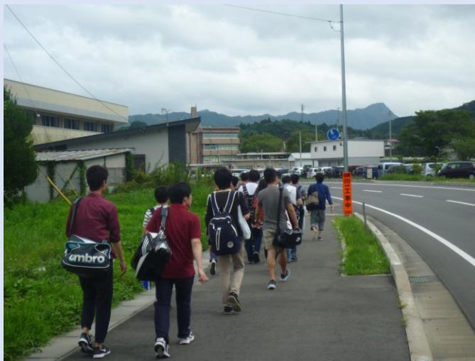
大子研修センターまで徒歩で移動。約30分。