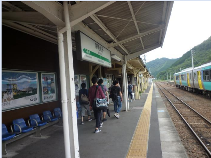
駅前の玉屋旅館にてしゃも弁当をいただきます。