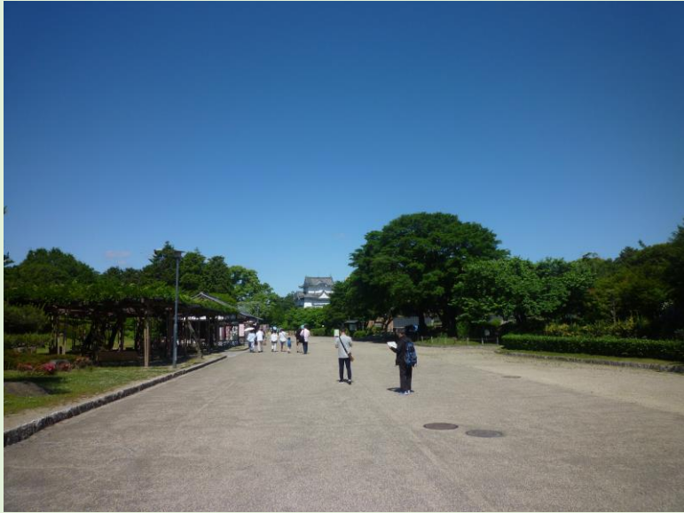
翌日は，午前中名古屋城を見学。