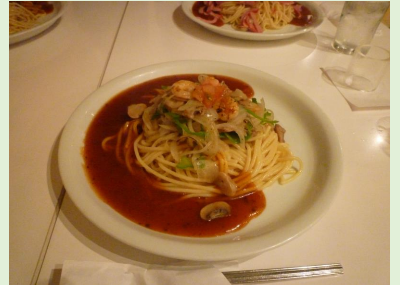
昼は、3人であんかけパスタ。ものすごい分量でした！