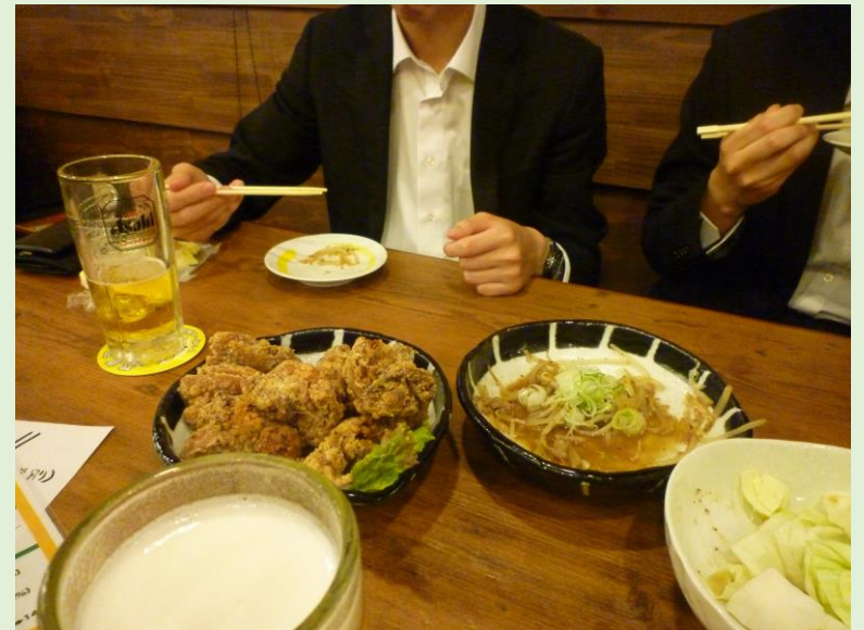
本日、無事終了！夕食はホテルの近隣にあった居酒屋へ。お疲れさまでした！