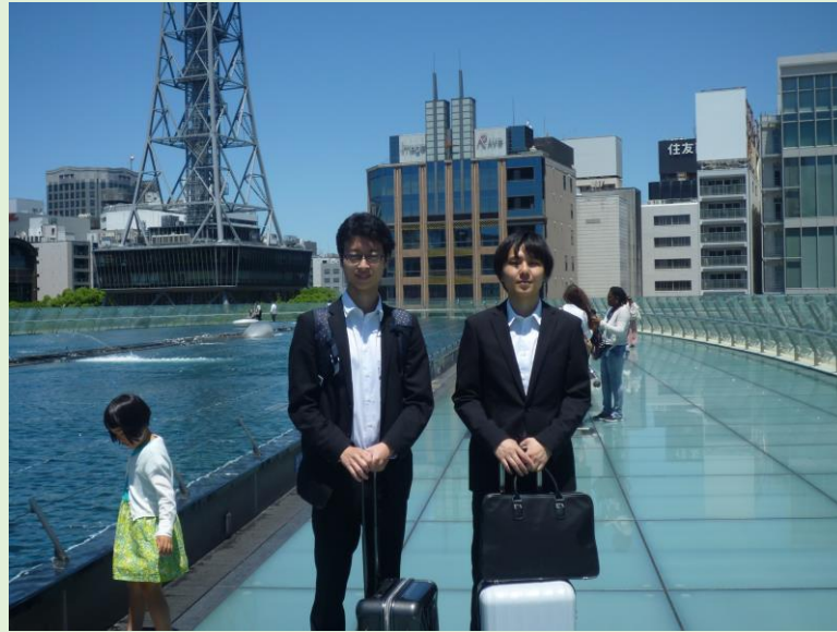
テレビ塔まで戻り、さらにちょっと見学。