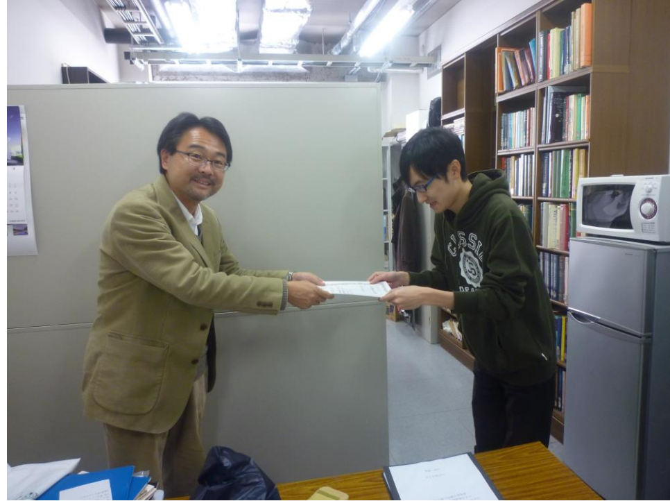
そして同じく2位は嶋君 (M2)