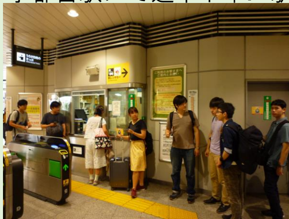
再び駅構内へ。那須塩原行へ乗車。