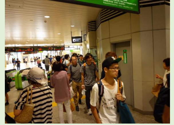
10時54分宇都宮駅に到着