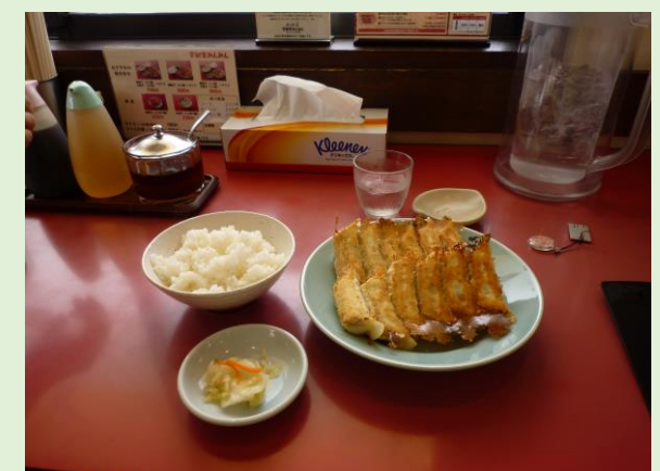
宇都宮駅にて途中下車。駅前の”みんな”で昼食。長蛇の列！！！！