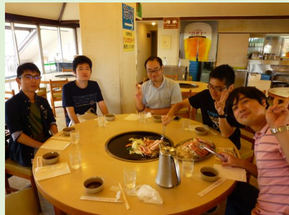
りんどう湖レイクビューにてBBQ食べ放題