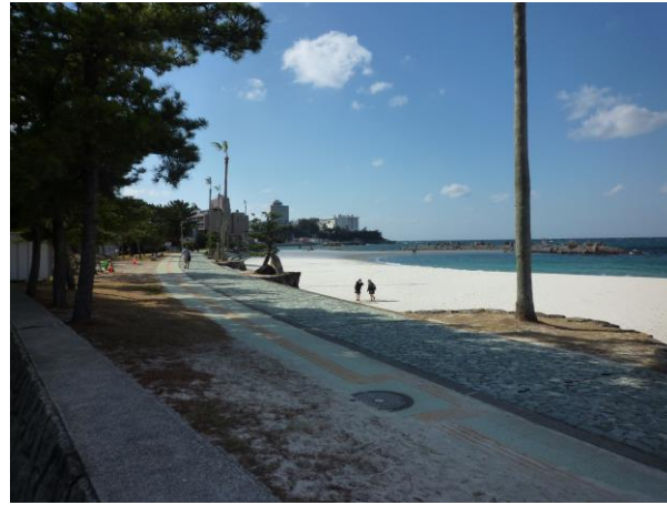
白良浜. 大変天気が良かったです.