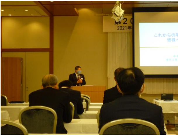
岸本先生の基調講演