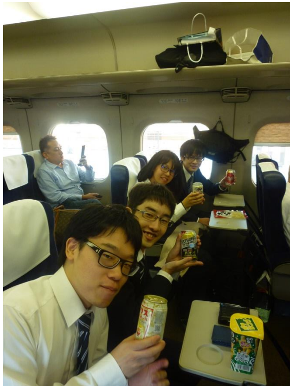
全員無事発表が終わり、みんなで新幹線で帰宅しました。ビールでリラックスの様子。お疲れ様でした！（荒井）