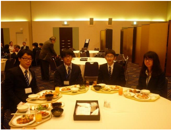
とりあえず午前の発表が終了。豪華な昼食をいただきました。