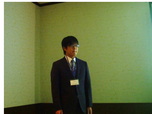
質問されていますね。