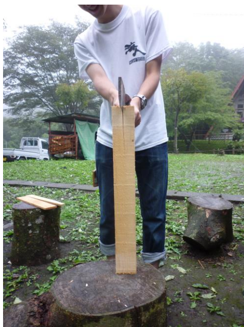
斧によるき裂進展試験