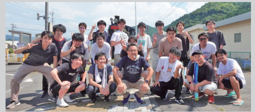
荒井研究室メンバー（ゼミ旅行）